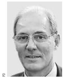
Paolo Emilio Signorini Präsident Ports of Genoa

den verschiedenen Terminals. Im August ist der Containerumschlag um 16% zurückgegangen, aber seit Ende September läuft es etwas besser. «Wir sind jetzt in einer Grauzone und wissen noch nicht, wie es weitergeht», sagt Signorini.