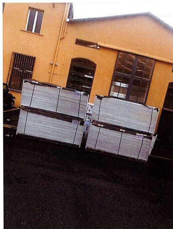
Immagini 1-2-3-4: operazioni di carico/scarico e stoccaggio sulle aree prospicienti i compendi demaniali in uso alla SAVI SRL